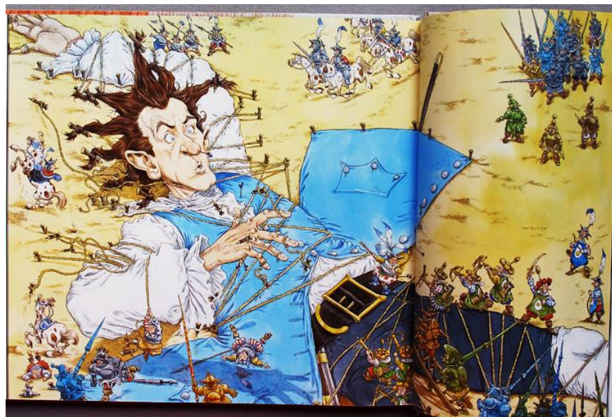
גוליבר בארץ ליליפוט, אייר כריס רידל