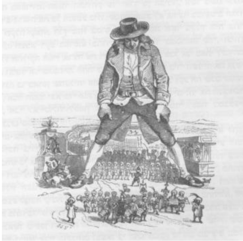
גוליבר בארץ ליליפוט, אייר גראנויל.

התבוננו באיורים של כריס רידל ושל גראנוויל המתארים את גוליבר בארץ לילפוט.